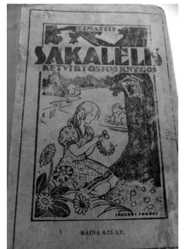
Universalus tarpukario laikų pradžios mokyklos vadovėlis „Sakalėlis“.