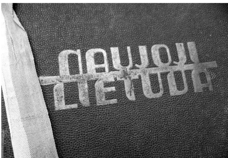
Jubiliejinių 1938 metų proga išleista Kazio Binkio knyga „Naujoji Lietuva“ buvo dovanojama visiems, tais metais baigusiems pradžios mokyklas.

Ne vien mokslas žmogų daro tikrai kultūringą, ne mažesnės reikšmės turi žmogaus dorovingumas ir geras būdas. Teisingumas, tvirta valia, žodžio laikymasis, mandagumas, savigarba – savybės, kurias privalu nuo pat mažens ugdyti. Jaunuo menės kelias aiškus: per darbą, mokslą, saviuoklę – į kultūringą, gražią ir laimingą Lietuvą. Juk ateina laikai, kai šviesus, darbštus, sąžiningas, sugebąs aukotis visuomenės labai žmogus kyla į pirmą eilę. Dabar nebeklausia, kokios žmogus kilmės, kiek turto paveldėjo ar paveldės, – bet žiūri, ar sąžiningas, šviesus, pareigingas, suprantantis visuomenės reikalus. Kviečia jaunuomenę į džiaugsmingą ir kūrybingą darbą – padaryti Tėvynę Lietuvą gražią ir laimingą. Naujoji Lietuva bus tokia, kokios jaunieji piliečiai panorės ir pasiryš siekti.