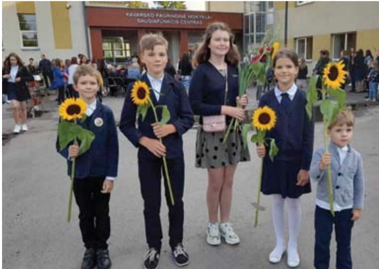
Jaunesni mokiniai noriai renkasi į Rugsėjo 1-osios šventę. Gėlės žiedas rankose – pagarbos mokytojui išraiška.

Vakar pirmasis skambutis nuskambėjo 182-iems Anykščių rajono mokyklų pirmokams. Didžioji jų dalis – 136 – mokysis Anykščių miesto mokyklose: Antano Baranausko pagrindinėje mokykloje (65) ir Antano Vienuolio progimnazijoje (71).