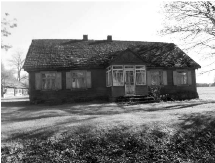
Šukių sodyba, kurioje tarpukariu veikė Mičionių pradžios mokykla.

Šią nuotrauką mokytoja namų šeimininkei padovanojo 1936 metų lapkričio 30 dieną, ant nugarėlės užrašydama: „Pažiūrėjusios į šį „abrozdelį“, prisiminsit tą laiką, kada Mičionyse gyveno naujakurė, kurią Jūs lankydavot, o tie apsilankymai man buvo labai malonūs“.