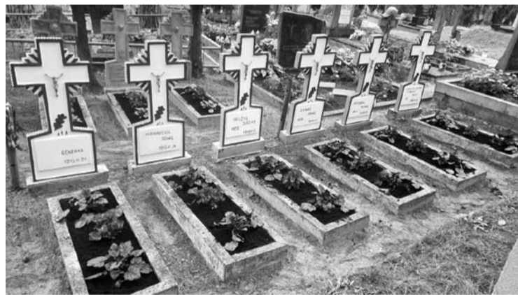
Atnaujinti Andrioniškio partizanų kapus, kuriuose palaidoti Algimanto kuopos partizanai, Anykščių rajono savivaldybei kainavo 650 eurų.

Paminklų priežiūros ir smulkaus remonto darbus atliko MB „Miške augė“ – nuvalė sama-